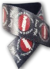
VELCRO ADESIVO RIUTILIZZABILE