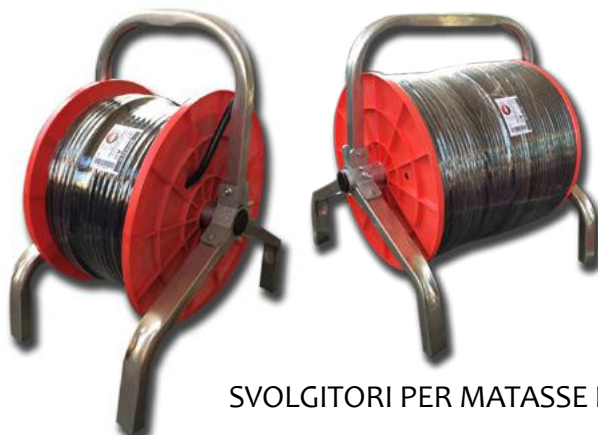
SVOLGITORI PER MATASSE E BOBINE